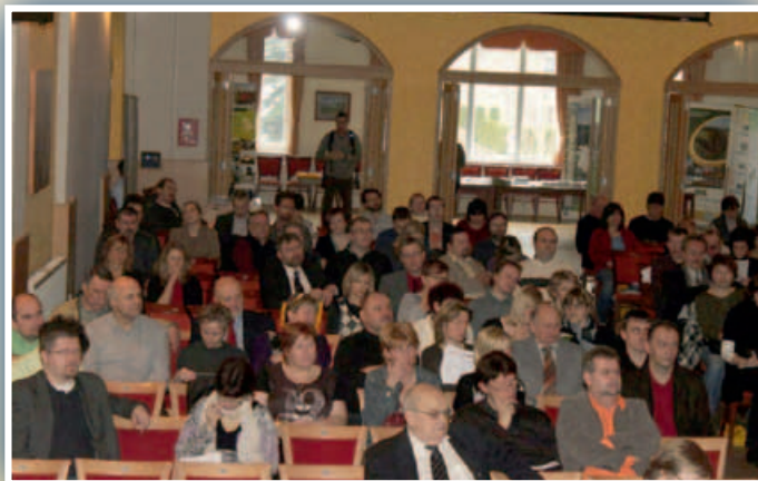
Zasedání Valné hromady NS MAS ČR, Rumburk